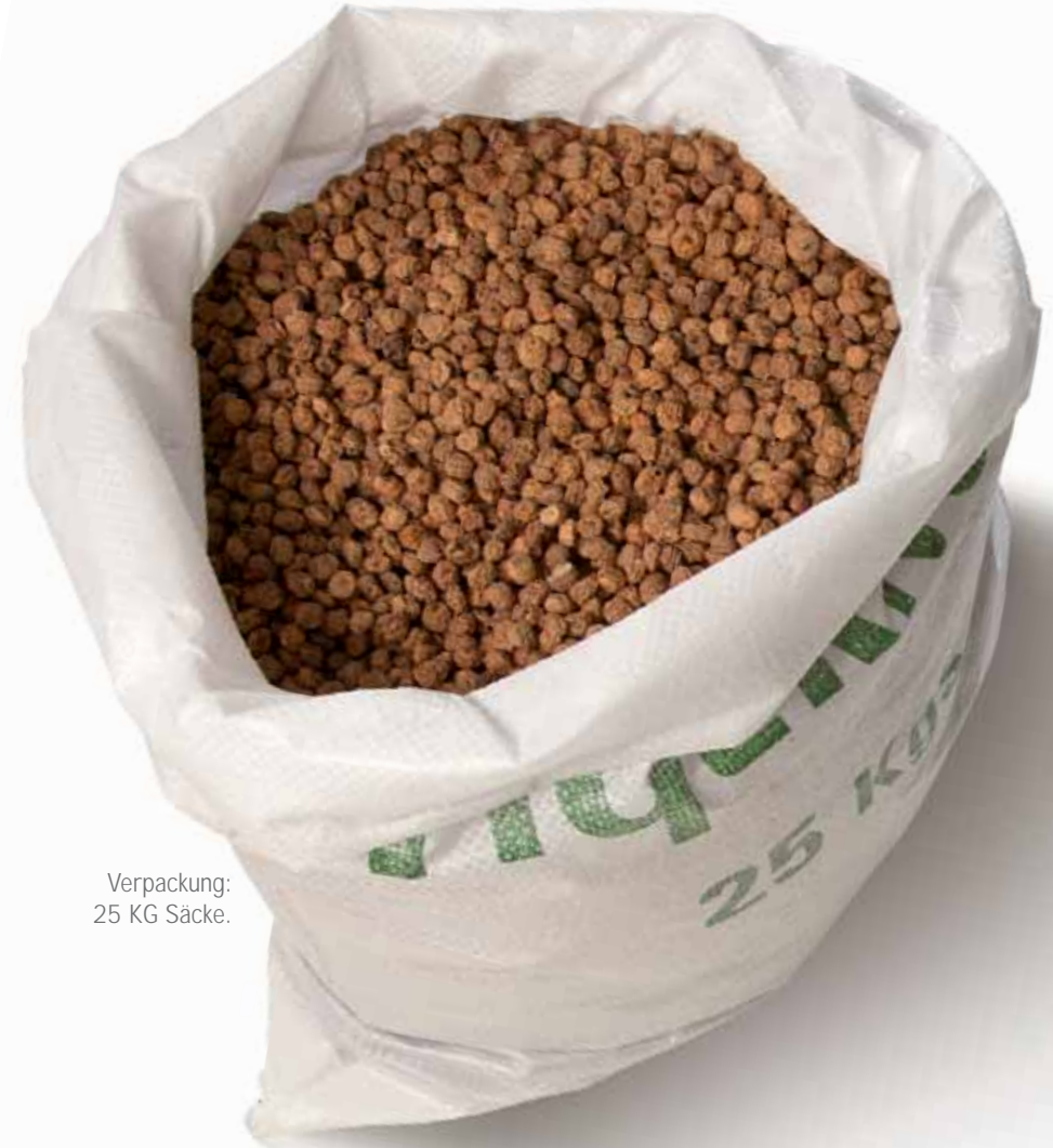
Verpackung: 25 KG Säcke.

Die Tigernüsse sind ein Partikel welches das ganze Jahr verwendet werden kann, obwohl sich seine Effektivität in warmen Wetter erhöht.