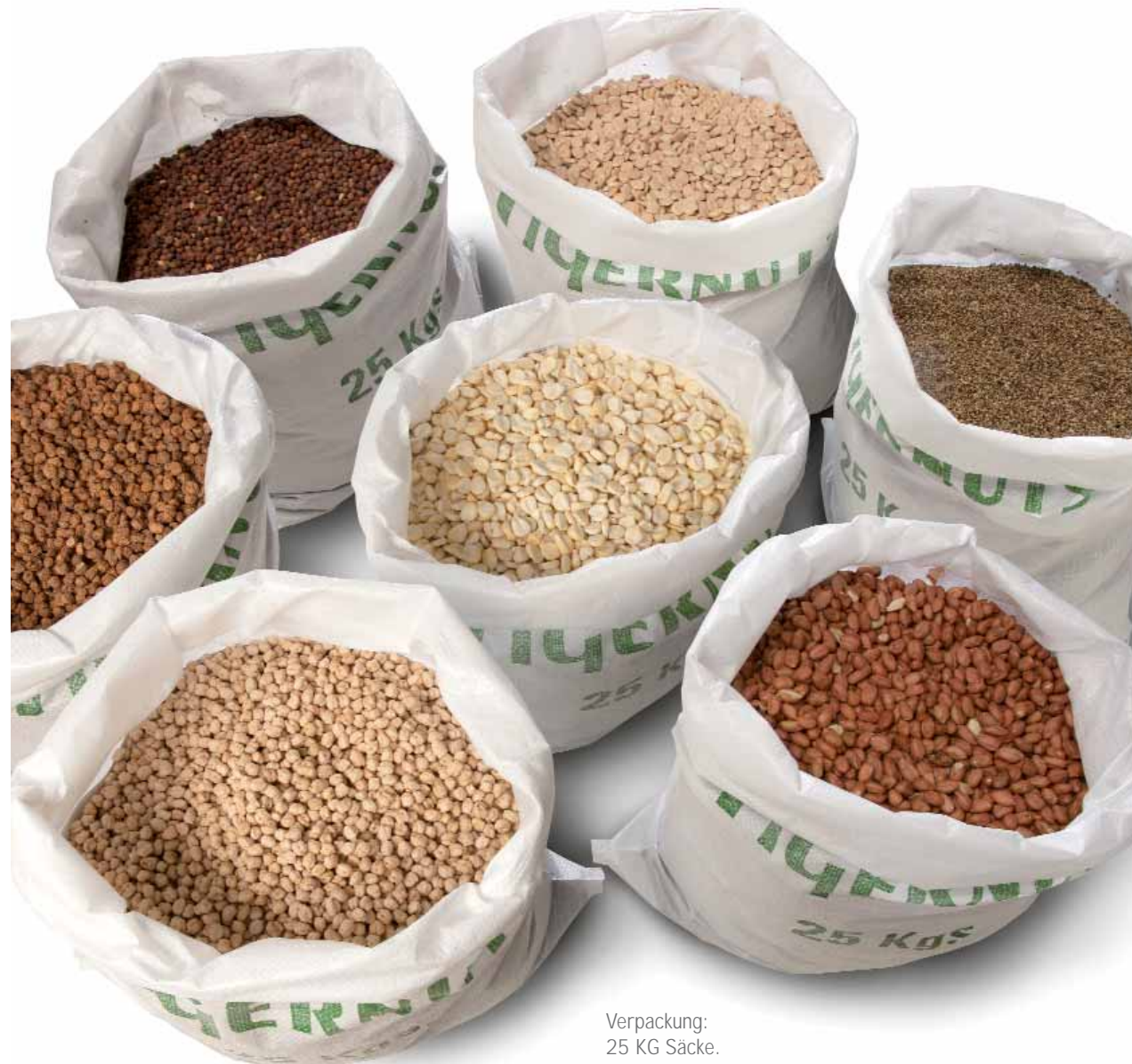
Verpackung: 25 KG Säcke.

Genauso wie der Mais und die Bohnen sind die roten Erbsen ein Köder welcher sofort funktioniert. Einer der Fehler ist die roten Bohnen zu viel zu benützen, was in einem längerem Zeitraum die Fangquote verringert. Deshalb wird dieser Partikel in der letzten Zeit nicht mehr so viel benützt. Sie haben ein Größe von ungefähr 5 bis 8 mm.